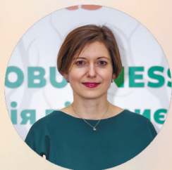
Ірина Ставчук , Заступник Міністра захисту довкілля та природних ресурсів України