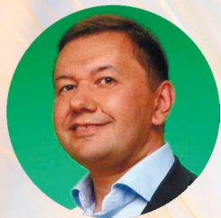
Олег Бондаренко , Голова Комітету Верховної Ради України з питань екологічної політики та природокористування

Сесія 1. Державна екотрансформаційна політика. Як Green Deal вплине на агросферу: шлях сталого розвитку 10.00 – 10.30 ДО ДИСКУСІЙ ЗАПРОШЕНО: