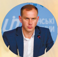
Андрій Мальований , Голова Держекоінспекції