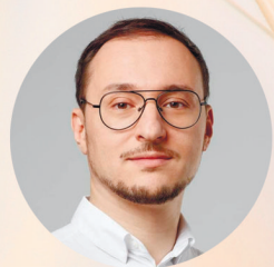
Олексій Рябчин , радник віце-прем'єрки з питань європейської та євроатлантичної інтеграції з EU Green Deal та міністра захисту довкілля і природних ресурсів