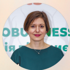
Ірина Ставчук , Заступник Міністра захисту довкілля та природних ресурсів України